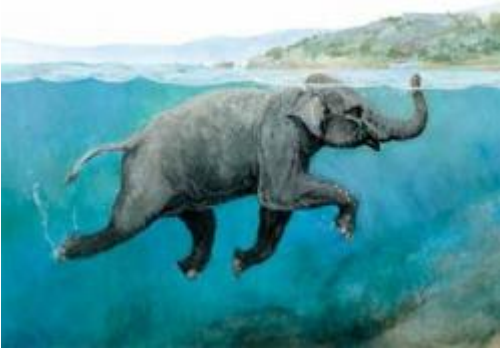
Pictura 3 (tertia)

natō, āre, āvī, ātum – plavat; sciō, īre, scīvī, scītum – umět, znát; perficiō, ere, perfēcī, perfectum – dokázat; nauta, ae, m. – plavec; bonus, a, um – dobrý;