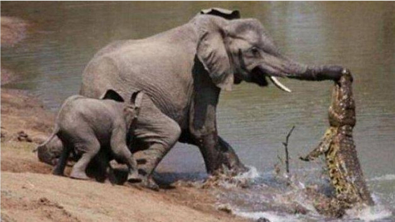
Pictura 4 (quarta)

natō, āre, āvī, ātum – plavat; sciō, īre, scīvī, scītum – umět, znát; perficiō, ere, perfēcī, perfectum – dokázat; nauta, ae, m. – plavec; bonus, a, um – dobrý;